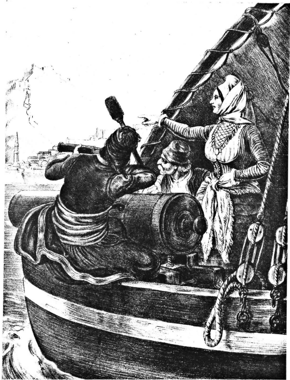
L'EROINA BOBOLINA CANNONEGGIA NAUPLIA