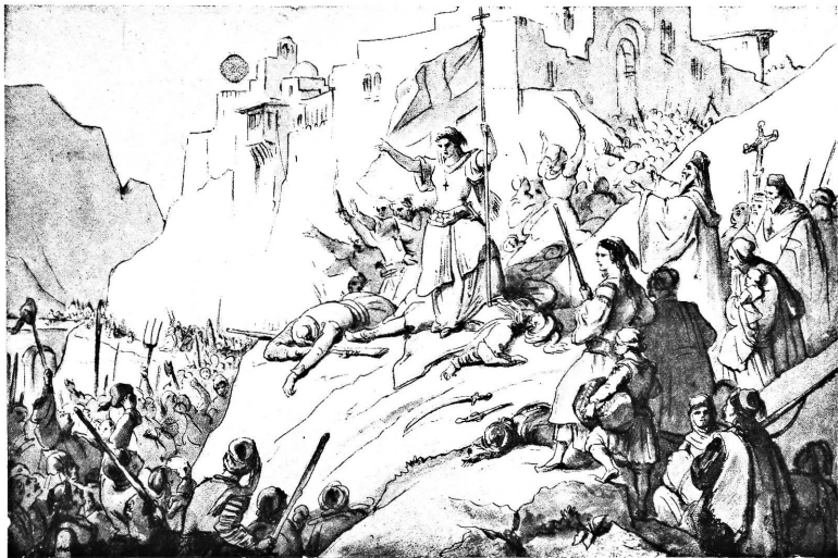
Fig. 2. - Costanza Zaccarias fa sollevare gli abitanti di Mistrà (Grecia). Disegno n. 38 di Gius. Lorenzo Gatteri nel Museo Revoltella di Trieste.